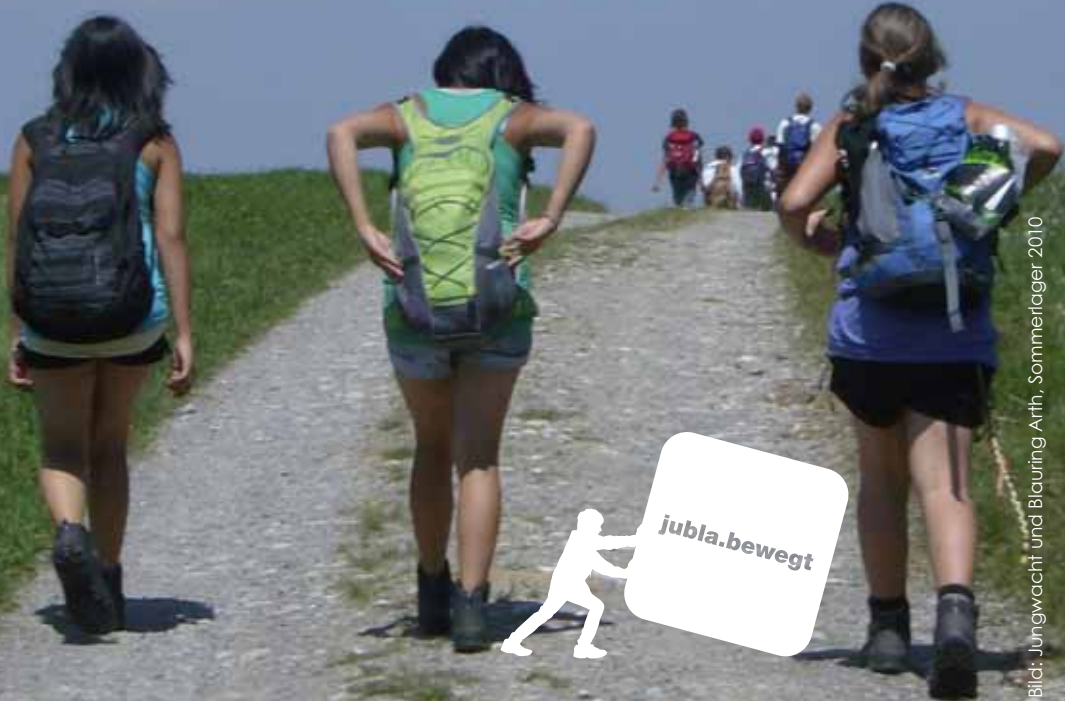
Bild: Jungwacht und Blauring Arth, Sommerlager 2010